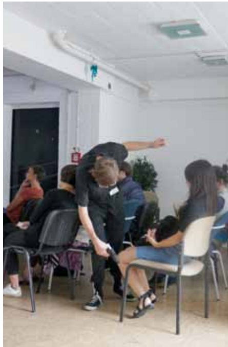
PAErsche_Präsentation Internet Plattform

Nach dem erfolgreichen Neubad Auftritt im 2016 steigt das Interesse an «The Gathering» als praktisches Tool der Performancekunst bei öffentlichen Kunstinstitutionen.